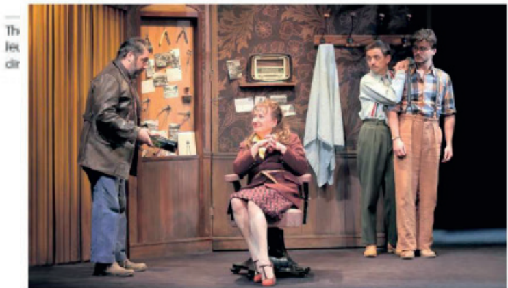
Une mise en scène qui, à partir de l'intime d'un petit groupe d'humains, ouvre la fenêtre sur le trouble d'une époque. Fabienne Rappeneau

« Force est de constater que ce petit coiffeur se tire remarquablement bien d'affaire »